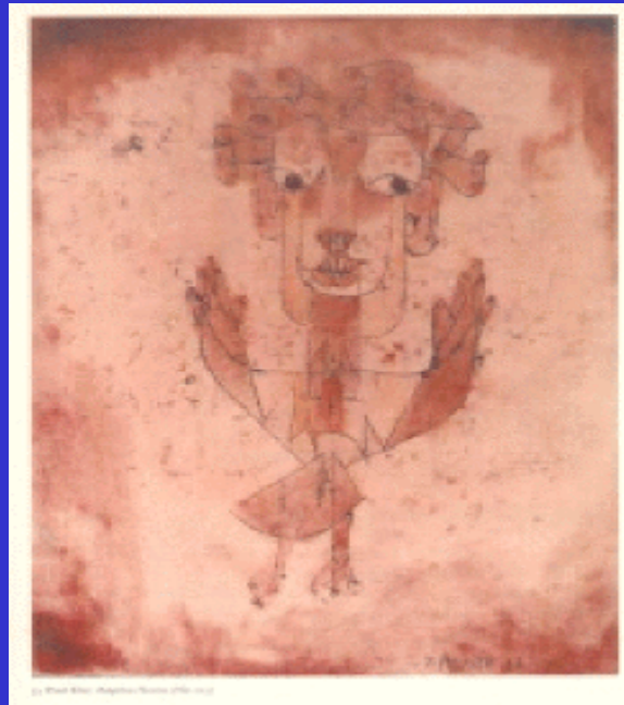
© 1920 Paul Klee, Angelus Novus , 1920